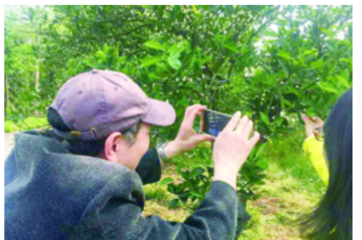
作者在胡柚基地拍摄胡柚花