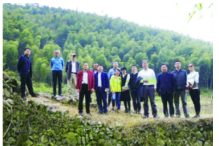
作家们在球川镇东坑村采风