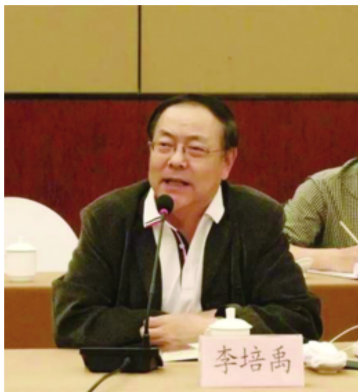
作者在全国生态文学创作研讨会上发言